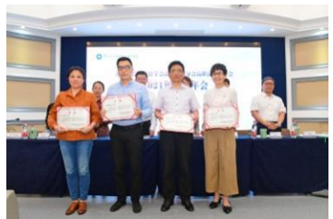
第四届理事会受聘变动成员合影