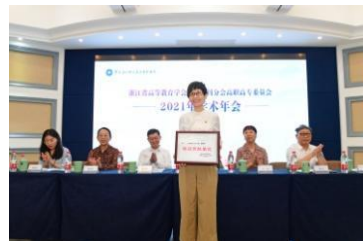
授予《宁波教育学院学报》特别贡献单位