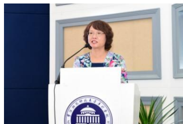
寿彩丽副理事长致贺辞