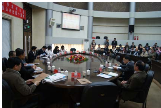
□ 全国高职高专学报学术研讨会会场

与会专家就如何办好学报做了专题发言，与会代表进行了办刊经验交流，同时，宁波职业技术学院学报还发起了“抵制学术不端行为倡议”，会议还进行了绿书签签名活动。